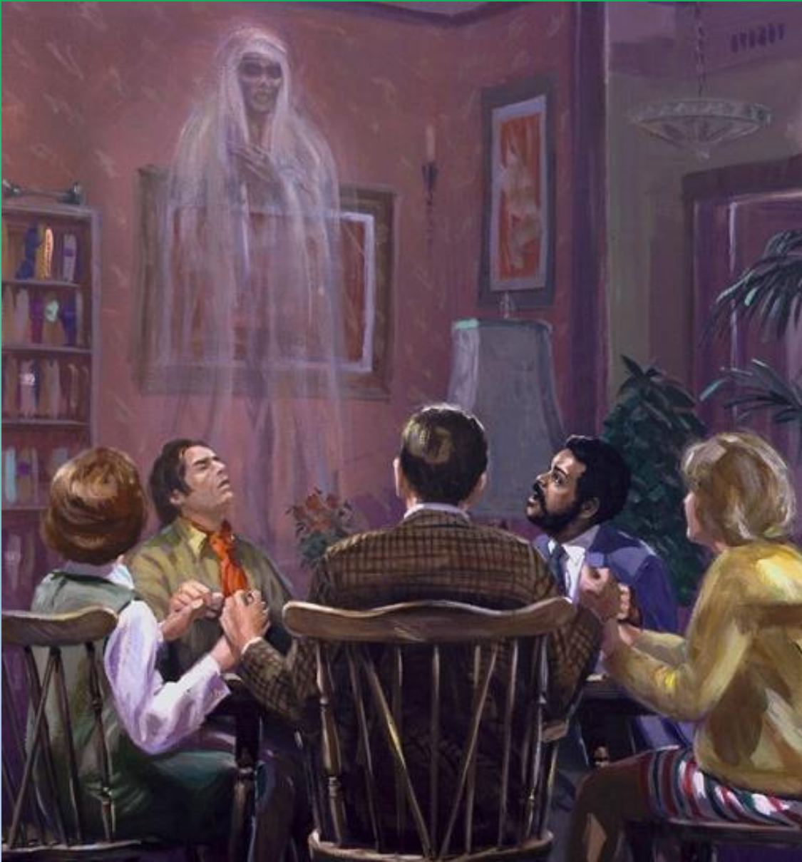
Lesson 11 for December 10, 2022