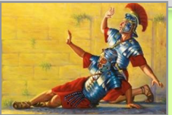
ရောမအစောင့်များ (Mt. 28:11)