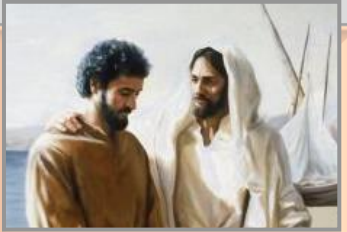
ပေတရု (Lk. 24:34; 1Co. 15:5)