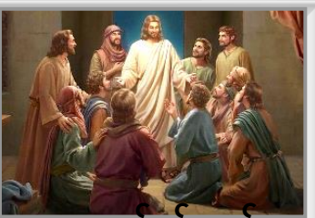
အထကခန်းတွင် စုဝေးကြသူများ (Mr. 16:14; Jn. 20:19)