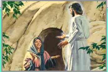
မာဂဒလမာရီ (Mr. 16:9; Jn. 20:16-18)