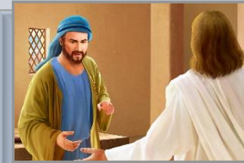
ယေရှု၏ညီ ယာကုပ် (1Co. 15:7)