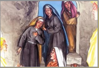
အမျိုးသမီးတစ်စု (Mt. 28:8-10)

ဓမ္မသစ်ကျမ်းတွင်ရေးထားသည့် အတိုင်းလူများစွာသည် ယေရှုရှင်ပြန်ထမြောက်သည်ကိုမြင်ပြီးသူ၏ရှင်ပြန်ထမြောက်ခြင်း၏သက်သေများဖြစ်လာခဲ့သည် (တမန် ၂:၃၂)။