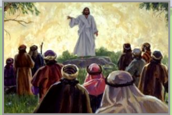
လူ ၅၀၀ ကျော် (1Co. 15:6; Mt. 28:16- 17)