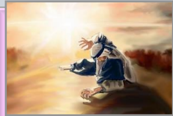
ပေါလု (1Co. 15:8)

ငါတို့သည်လည်း ယုံကြည်ခြင်းအားဖြင့် ရှင်ပြန်ထမြောက်ခြင်း၏ သက်သေများဖြစ်သည် (ယော၊ ၂၀:၂၉)။