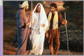
မောက်တပည့်များ (Lk. 24:13-15; Mr. 16:12)